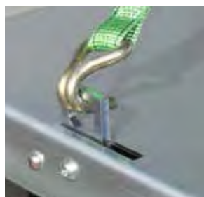
6 versenkte Zurringe mit je 600 kg Zugkraft