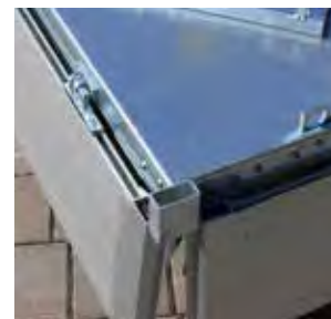
Alu-Bordwände vierseitig abklapp- und abnehmbar